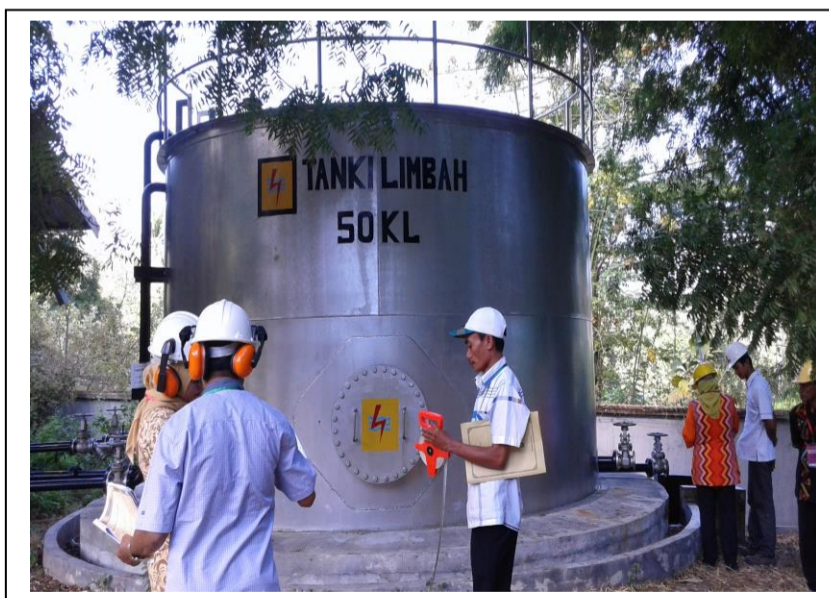
SURVEI LOKASI DI PLTD NIU – KOTA BIMA