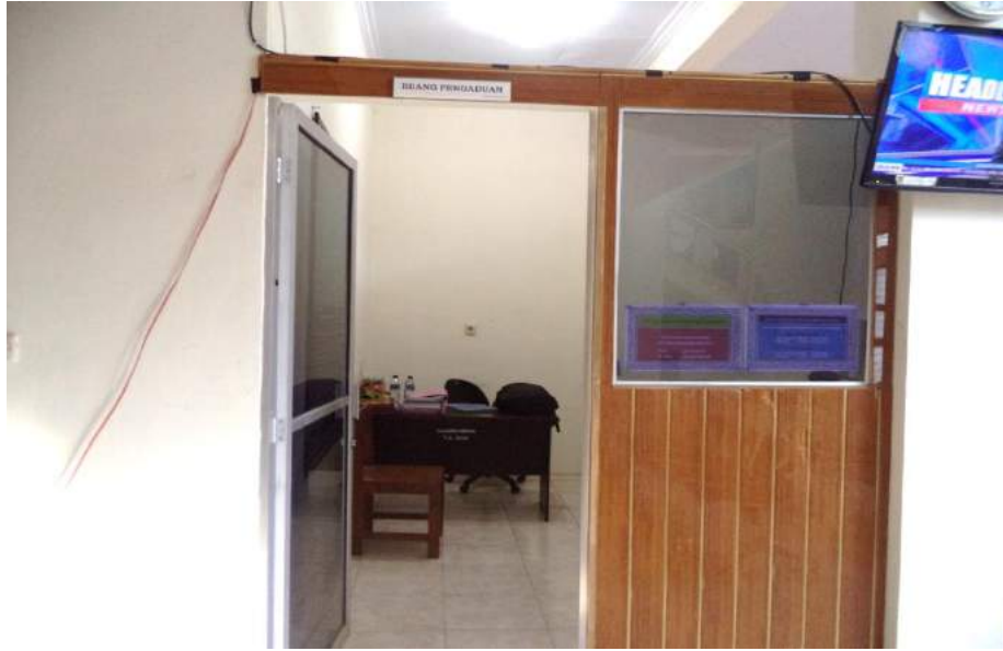
FOTO LOKET PENGADUAN DPMPTSP KOTA BIMA